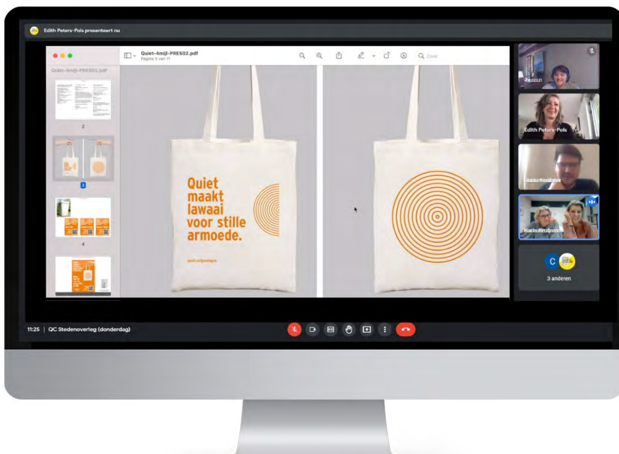
Ook tijdens online video-vergaderingen versterken de projectleiders elkaar.

Tussen de projectleider van Quiet Nederland en de projectleiders van de Community's is om de twee weken een video-overleg gehouden. Waarbij het uitwisselen van kennis, informatie en ervaringen hoog op de agenda staat. Verder hebben we geïnvesteerd in onderzoek voor een nieuw intranet en de keuze gemaakt om die in te richten. Deze wordt in 2022 in gebruik genomen.